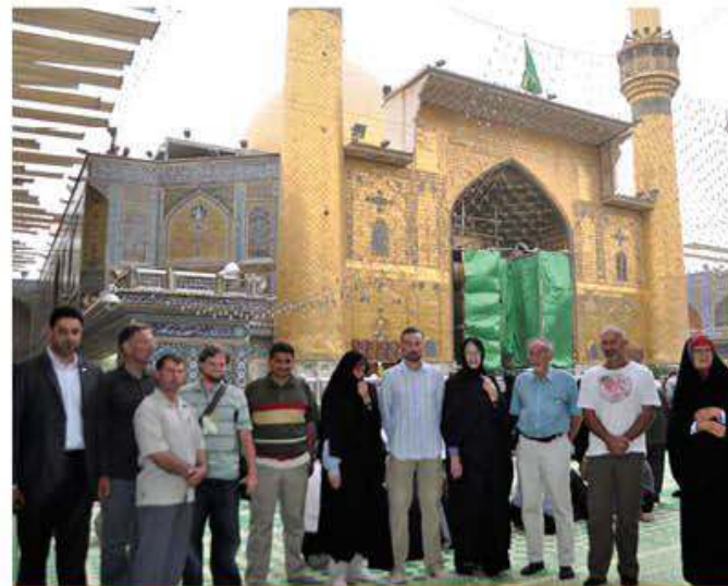
وفد من جنسيات متعددة