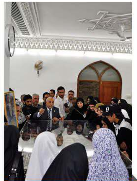
وفد من المستبصرين