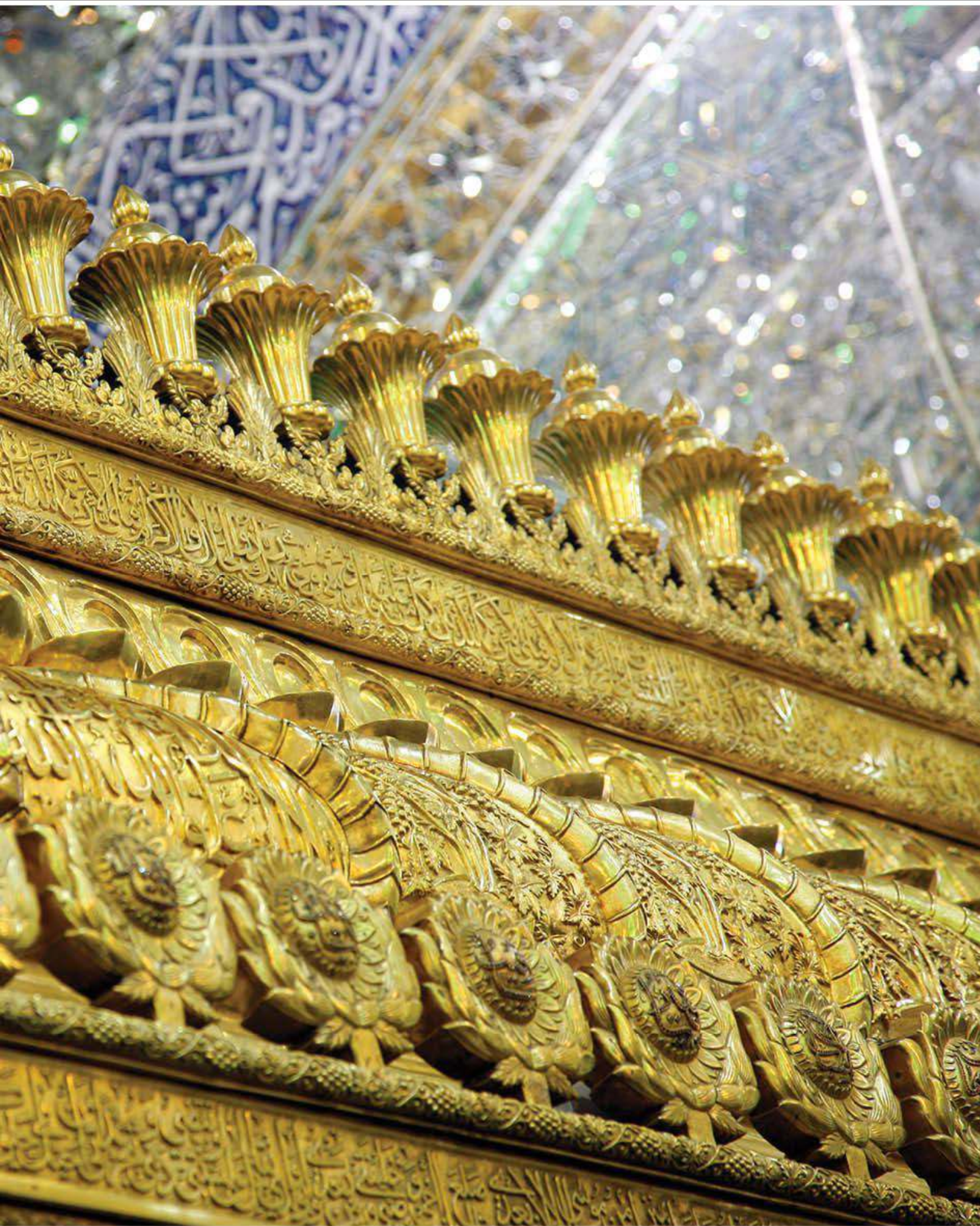
صورة للناح الذهبية لشبّاك ضريح الأمام علي عليه السلام التقطت عام ١٤٣٣هـ.