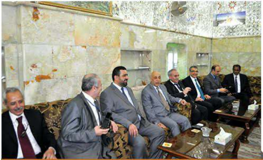
وفد من غرفة التجارة من تركيا