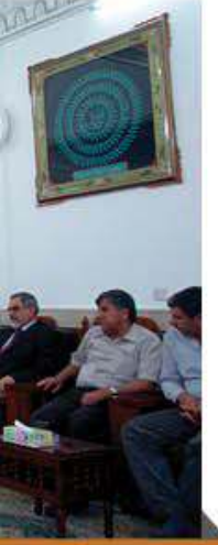
وفد من المهندسين