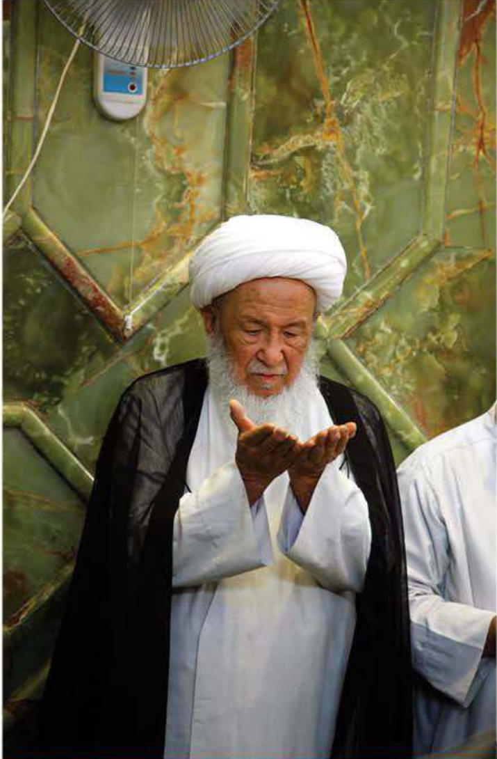
آية الله العظمى سماحة الشيخ محمد اسحاق الفيّاض (دام ظلّه)