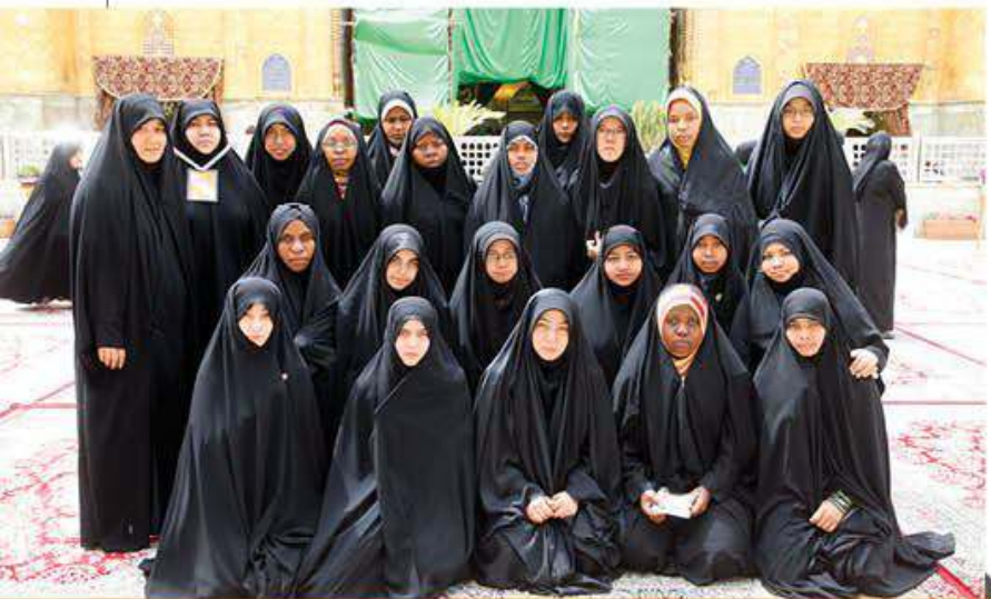
مستبصرات من جنسيات متعددة