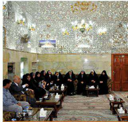
لكلية التربية للبنات في جامعة الكوفة