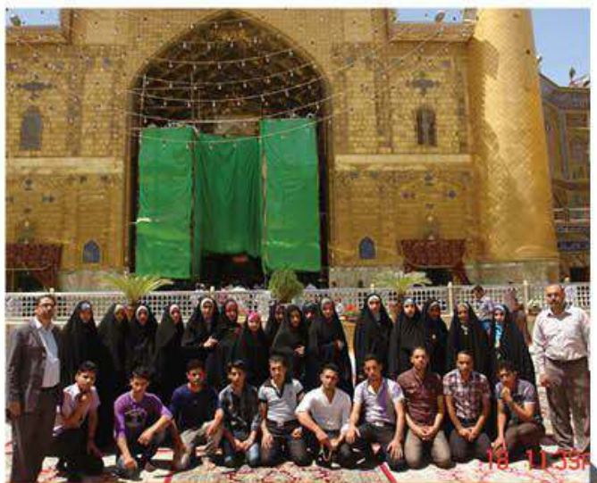
وفد من جامعة بابل